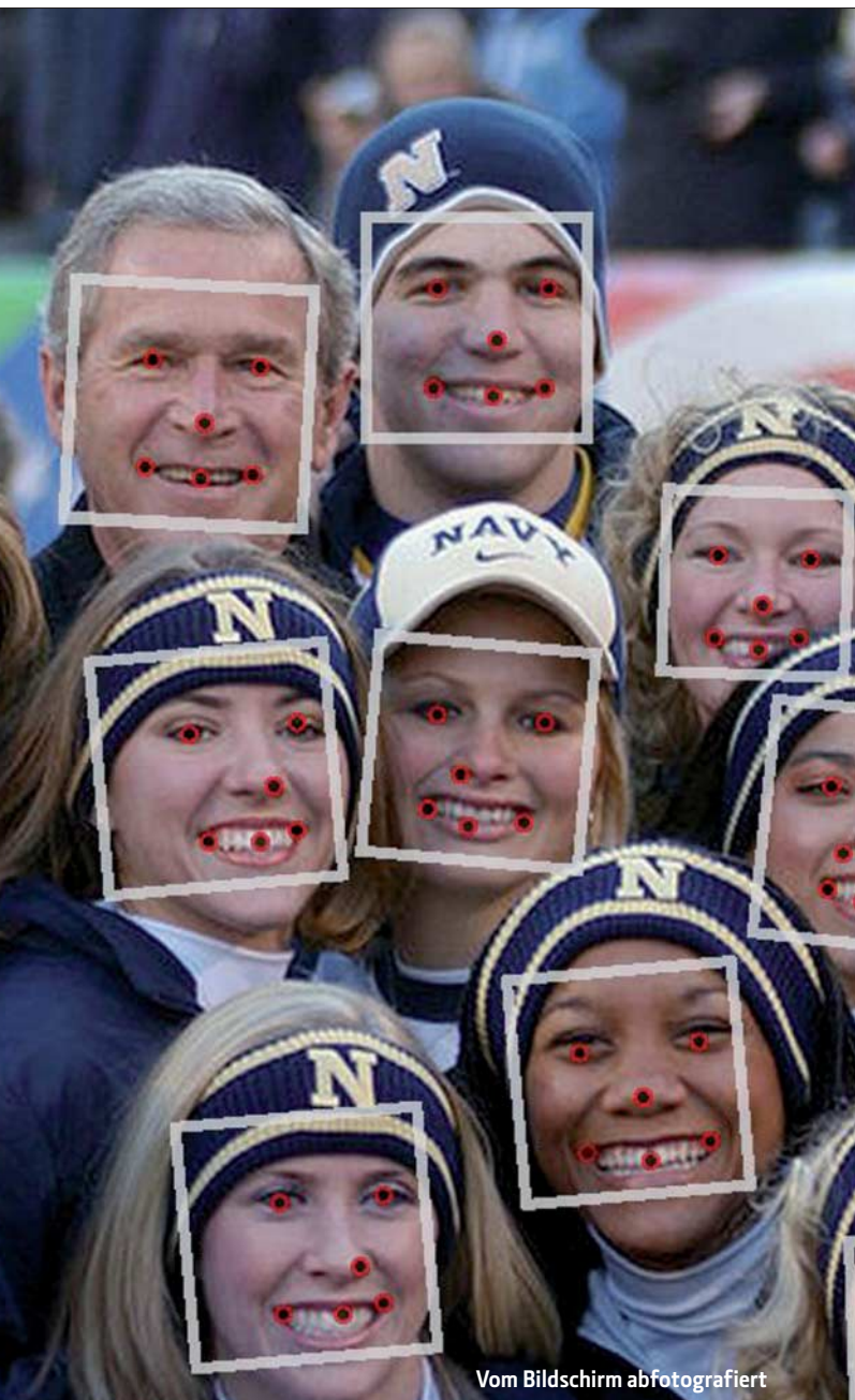
Vom Bildschirm abfotografiert